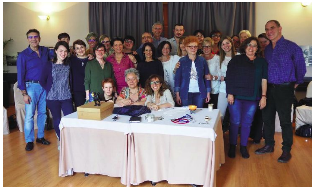
L'equipe all'ultimo corso sulla Comunicazione Empatica

dall'inizio, di unire le necessità di divulgazione e di informazione, sulle proprie attività e sui propri progetti, ad eventi musicali e teatrali. Nel tempo, l'Associazione ha tessuto e approfondito collaborazioni con compagnie teatrali, attori e musicisti, dando vita a diverse decine di eventi, alcuni veri e propri appuntamenti annuali in tutto il vimercatense, come la Sagra di Sant'Antonio, la Sagra della Patata, e i Concerti d'Estate e di Natale. Ci aiutano non solo a farci conoscere ma anche a conoscere a nostra volta nuove persone, aziende, fondazioni e altro che si aggiungono come sostenitori attivi dei nostri progetti.