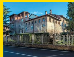
13 CASTELLO LAMPUGNANI Sulbiate