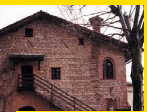
6 CASINO DI CACCIA BORROMEO Oreno di Vimercate