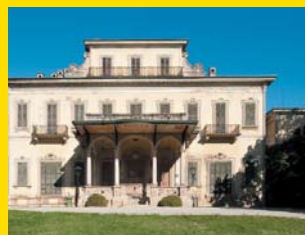
8 VILLA BORROMEO D'ADDA Arcore