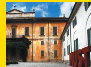
1 MUST MUSEO DEL TERRITORIO VILLA SOTTOCASA Vimercate