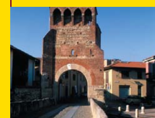
3 PONTE DI SAN ROCCO Vimercate