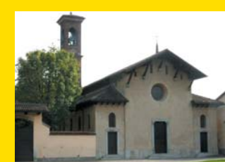
11 CHIESE E ORATORI Concorezzo

Il territorio della Brianza orientale, tra Vimercate e l'Adda, conserva tuttora valori e caratteri paesaggistici e naturali quasi completamente scomparsi nel Nord-Milano: una campagna lievemente ondulata nella quale si sono preservate alcune notevoli tracce della storia.