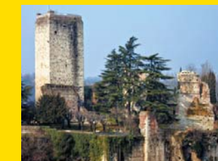
14 CASTELLO VISCONTEO Trezzo sull'Adda