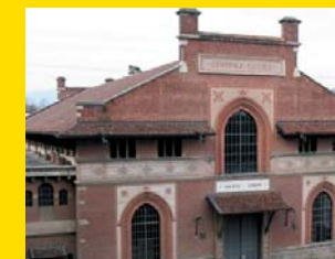
12 CENTRALI IDROELETTRICHE Cornate d'Adda