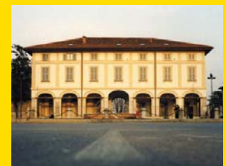
15 VILLA BELGIOIOSO SCACCABAROZZI Usmate Velate