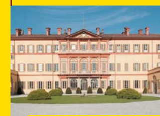
5 VILLA GALLARATI SCOTTI Oreno di Vimercate