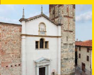
4 COLLEGIATA DI SANTO STEFANO Vimercate