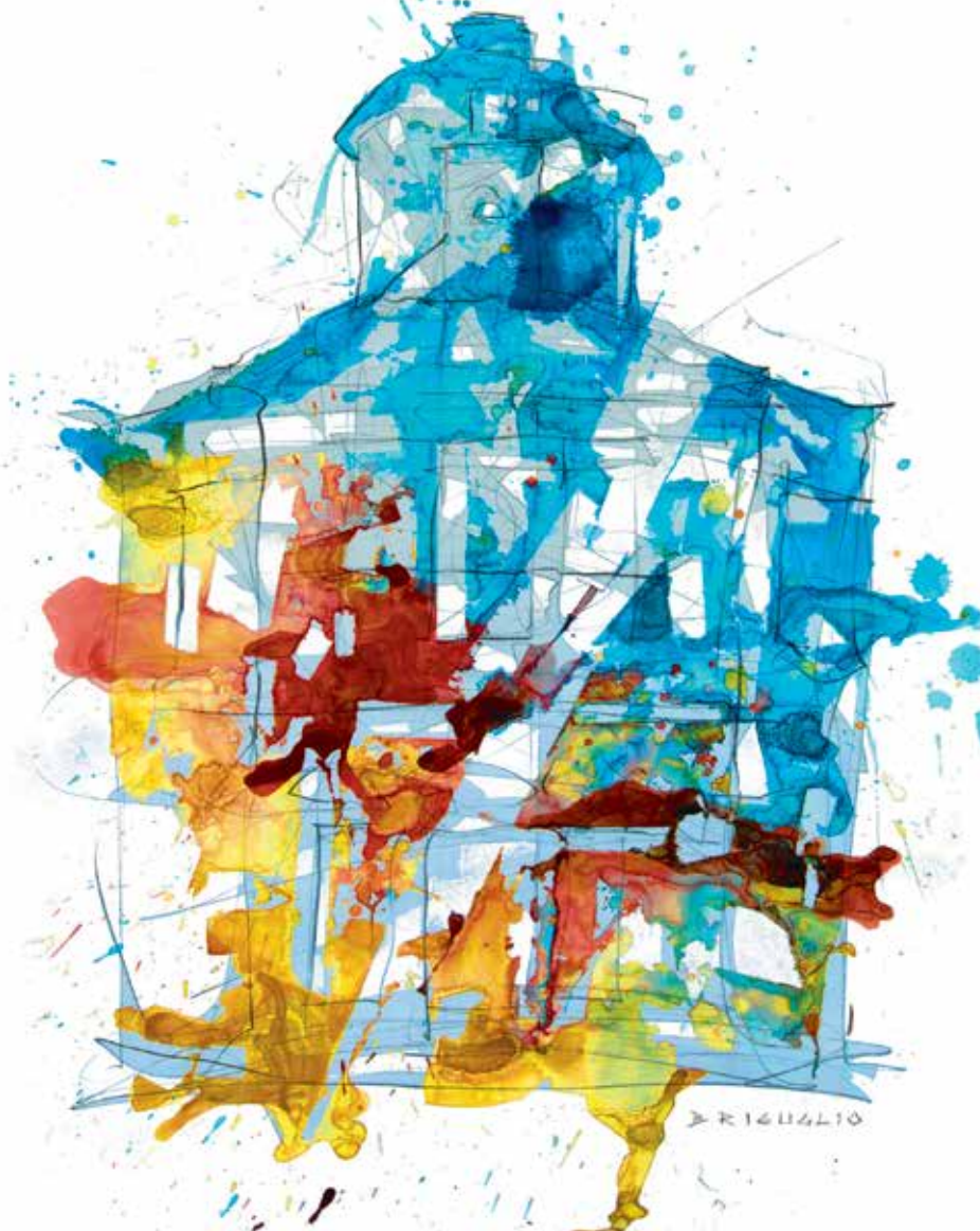
IMMAGINE: MIRKO BRIGUGLIO