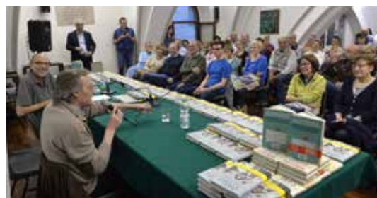
Un'immagine tratta dall'edizione 2016: incontro con lo scrittore Andrea Vitali