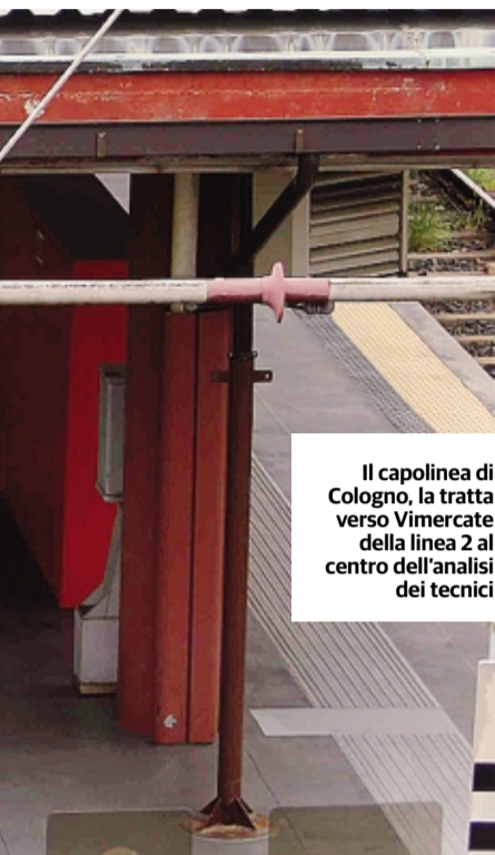
Il capolinea di Cologno, la tratta verso Vimercate della linea 2 al centro dell'analisi dei tecnici

Dibattito tra i sindaci dei Comuni interessati. Tra entusiasmo, scetticismo e qualche ipotesi alternativa