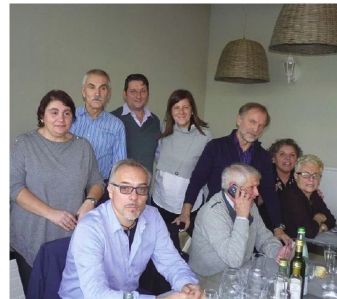
Alcuni membri del Circolo culturale Orenese durante il pranzo per il 50° della Sagra della Patata