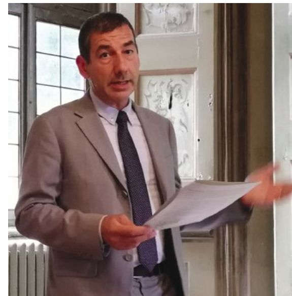
Il sindaco Francesco Sartini ha preso posizione condannando i ripetuti attacchi attraverso i Social all'operato dei dipendenti comunali

Secondo Sartini è troppo facile e per certi versi inaccettabile criticare senza conoscere il funzionamento della macchina amministrativa e gli impegni degli uffici: «Agli occhi di chi non conosce la quantità di istanze alle quali gli uffici del Comune devono fare fronte, è normale che risulti più evidente il singolo caso in cui una risposta non arriva nei tempi e nei modi sperati (mai per scarsa volontà) e che passino invece inosservate tutte le volte, che sono la stragrande maggioranza,