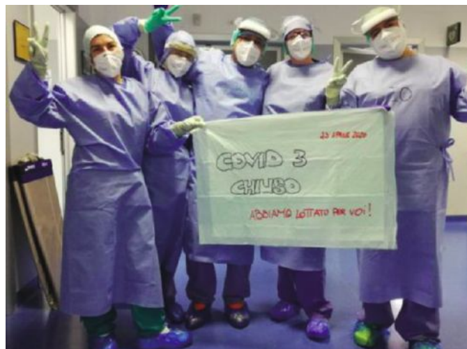
Infermieri di Vimercate esultano per la chiusura di uno dei reparti Covid