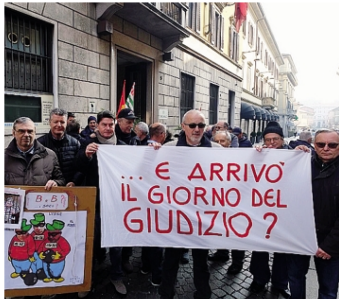
Uno dei presidi degli ex dipendenti Bames davanti al tribunale a Monza

La giornata di ieri ha visto chiudersi (in primo grado) il primo filone processuale dell'annosa vicenda, che ha subito molte lungaggini anche per il trasferimento del fascico-