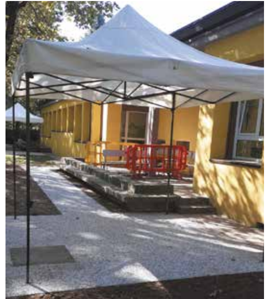
Il nuovo gazebo della scuola Rodari

sugli impianti elettrici, comprese le modifiche imposte dalla nuova organizzazione degli spazi legata all'emergenza sanitaria.