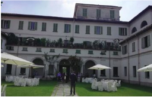
Villa Antona Traversi a Meda, che ha ospitato la presentazione di Ville Aperte 2020

propositi positivi in un momento storico in cui dobbiamo avere fiducia, pur con tutte le attenzioni dovute».